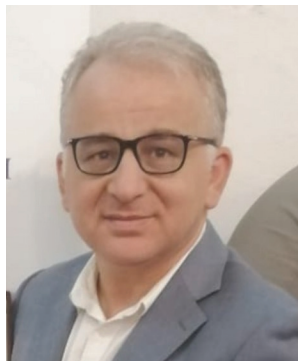
di Nunzio Currenti

Un raduno veramente unico per una passeggiata – che ha visto in prima linea anche Blu di Mare Circolo Parasio, scuola mtb Imperia e il set-